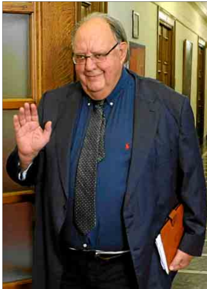
El ex vicepresidente griego Theodoros Pangalos.

La respuesta ciudadana fue altísima: unas 7.000 personas respondie-